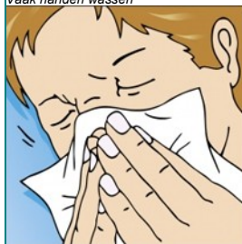
Hoesten of niezen? Zakdoek kiezen!

Gebruik zeep, droog goed af, gooi (papieren) handdoek weg.