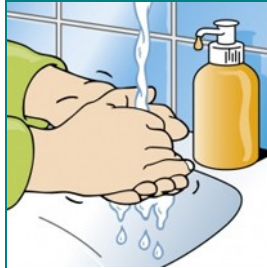
Vaak handen wassen

Bij griepverschijnselen thuis blijven, kinderen met hoesten en koorts (> 38) dit thuis (7 dagen) uitzieken en contact opnemen met de huisarts. Bij meer dan één leerling per klas ziek, GGD waarschuwen.